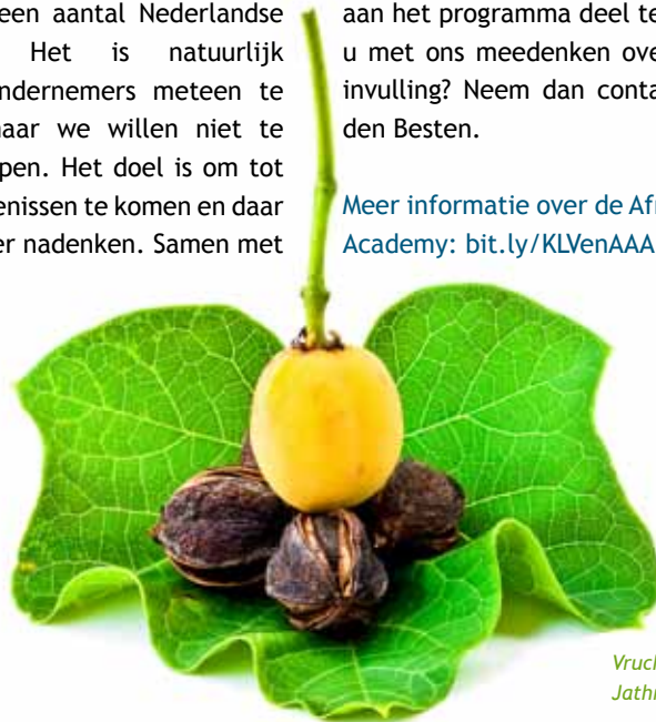
Vrucht en blad van de Jatropha-plant

Meer informatie over de Africa Agribusiness Academy: bit.ly/KLVenAAA